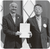
Mソバハ二会員へ 委嘱状

四国においては、戸建以外があまり進んでいません。資産活用事業や駅前再開発の街づくりなどを今後進めていきたいと思っています。つたないお話でもうしわけありませんでしたが、以上に自己紹介とさせていただきます。