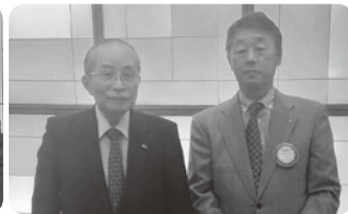
白井会長と石川様