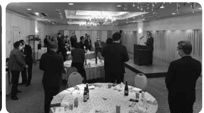
香川第一分区会長 幹事会